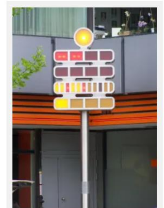
Le Mengenteleuhr affiche 10:31