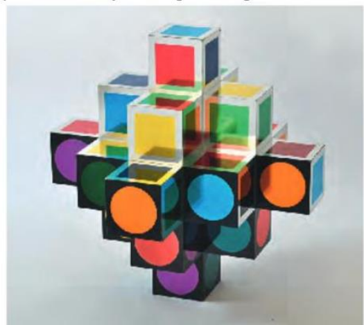
Kroa Multicolor (1963), Victor Vasarely Fondation Vasarely, Aix-en-Provence

Voici l'œuvre Kroa Multicolor de Victor Vasarely, peintre et plasticien français d'origine hongroise (1906-1997) :